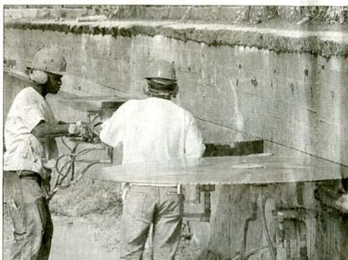
Operai al lavoro in via Corsica per il «taglio» del muro

Dopo i ritardi causati dalla pioggia, sono iniziate ieri le operazioni per il «taglio» del muro lungo via Corsica. Prosegue quindi l'iter di interventi legati ai lavori per la costruzione della terza corsia (più quella di emergenza) della Tangenziale Sud, lungo il tratto compreso tra il casello di Brescia centro e lo svincolo dell'Eib.